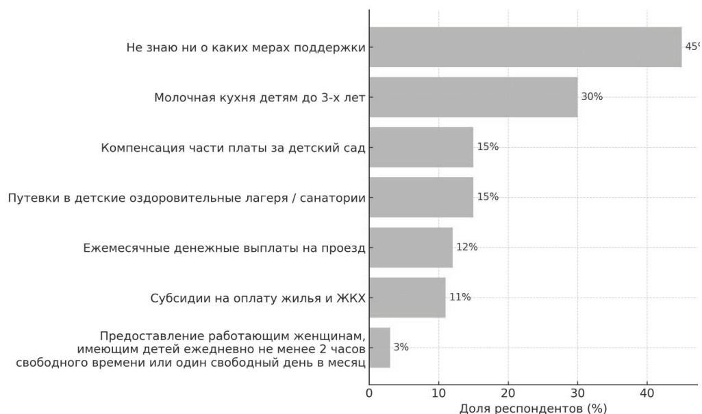
Рисунок 2. Информированность татарстанцев о республиканских мерах государственной поддержки семей с детьми

Для женщин характерна более высокая информированность по таким мерам поддержки, как молочная кухня (35% VS 21%), компенсация части оплаты за детский сад (18% VS 9%), предоставление свободного времени матери, которая трудоустроена (5% VS 1%), в то время как мужчины чаще упоминают о транспортных преференциях (15% VS 11%) и скидках на оплату услуг ЖКХ (12% VS 10%). Предоставление путевок в детские лагеря и санатории пример-